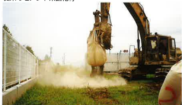
従来のセメント系固化材