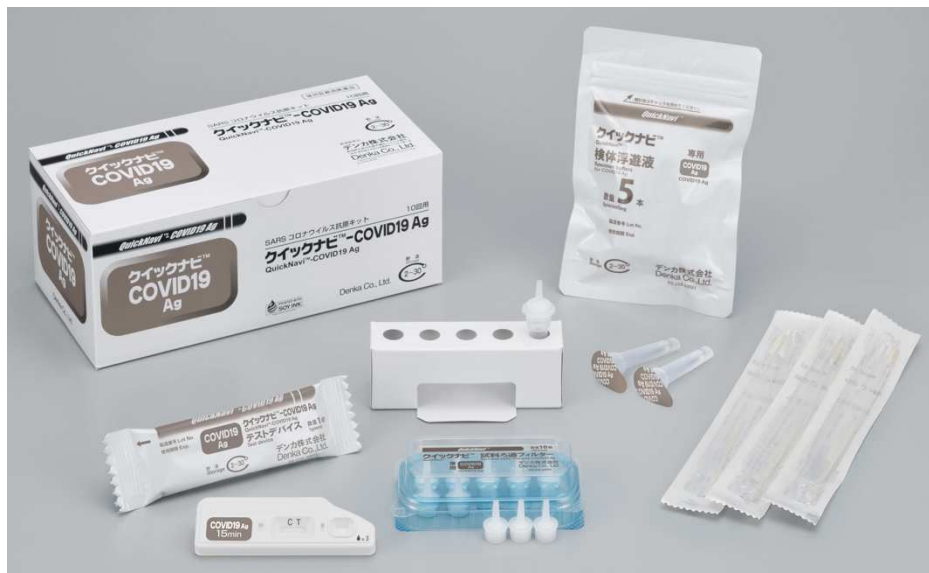
< 新型冠状病毒抗原快速诊断试剂盒 “Quick Navi™ -COVID19 Ag” >

获得新型冠状病毒抗原快速检测试剂盒的日本国内生产销售许可 ～产品名为“Quick Navi™ -COVID19 Ag”，8月13日开始向医疗机构销售～