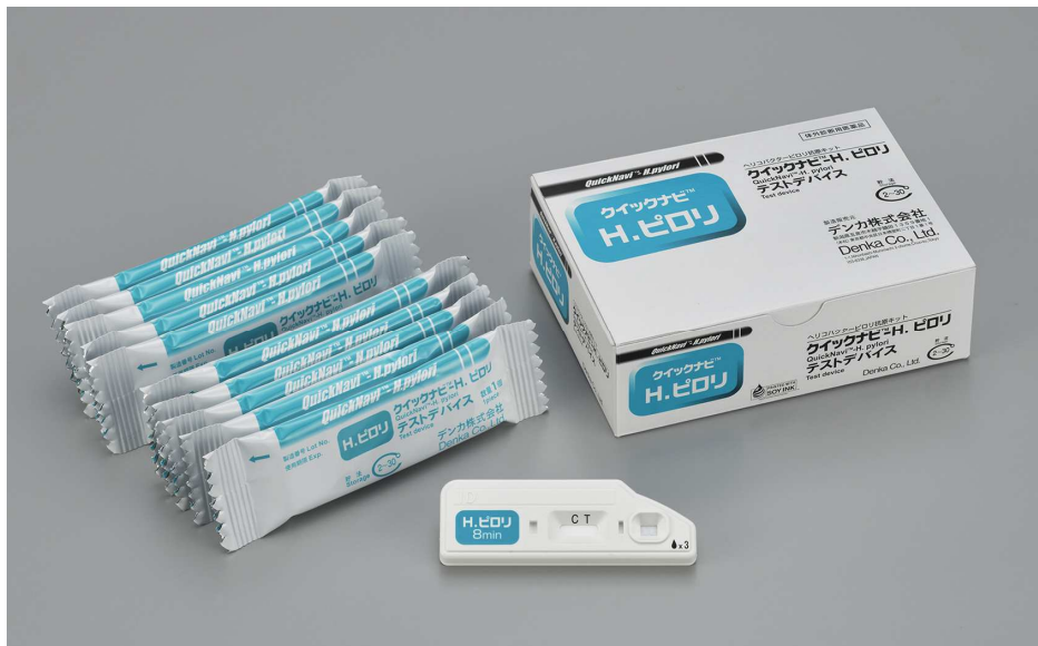
<ヘリコバクター・ピロリ抗原迅速診断キット「クイックナビ™ - H.ピロリ」>

ヘリコバクター・ピロリ抗原迅速診断キット「クイックナビ™ - H.ピロリ」を4月14日に発売