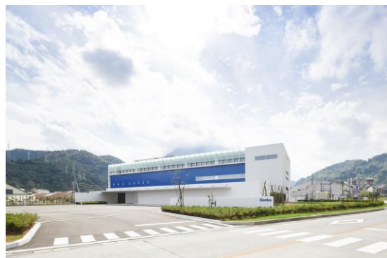
Omi Innovation Hub 外観