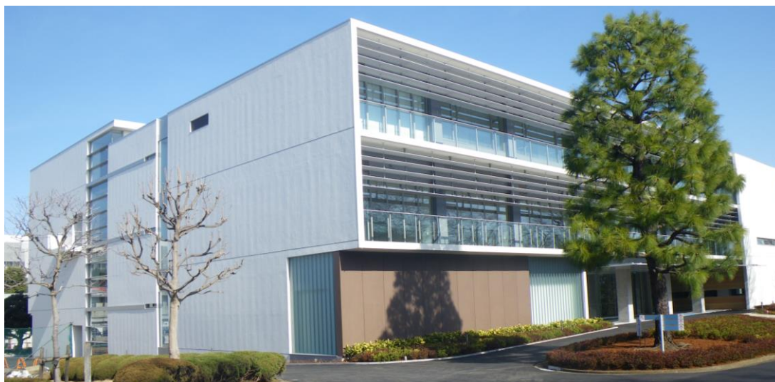
（完成間近のデンカイノベーションセンター本館）