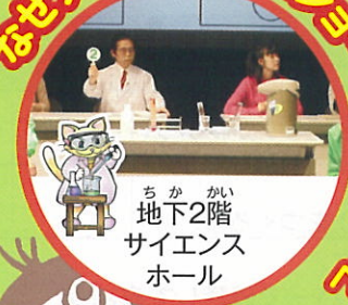
地下2階 サイエンス ホール