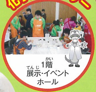
1階 展示・イベント ホール