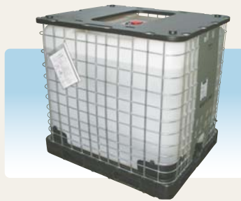
「デンカナトミックLSA」製品外観