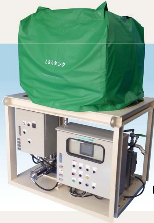
「デンカナトミックLSA」 添加システム