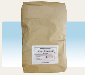
「デンカΣショットV」製品外観