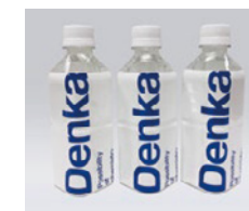
ペットボトルラベルの使用例